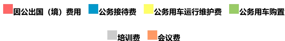
图 3、“三公”经费、培训费、会议费支出预算构成